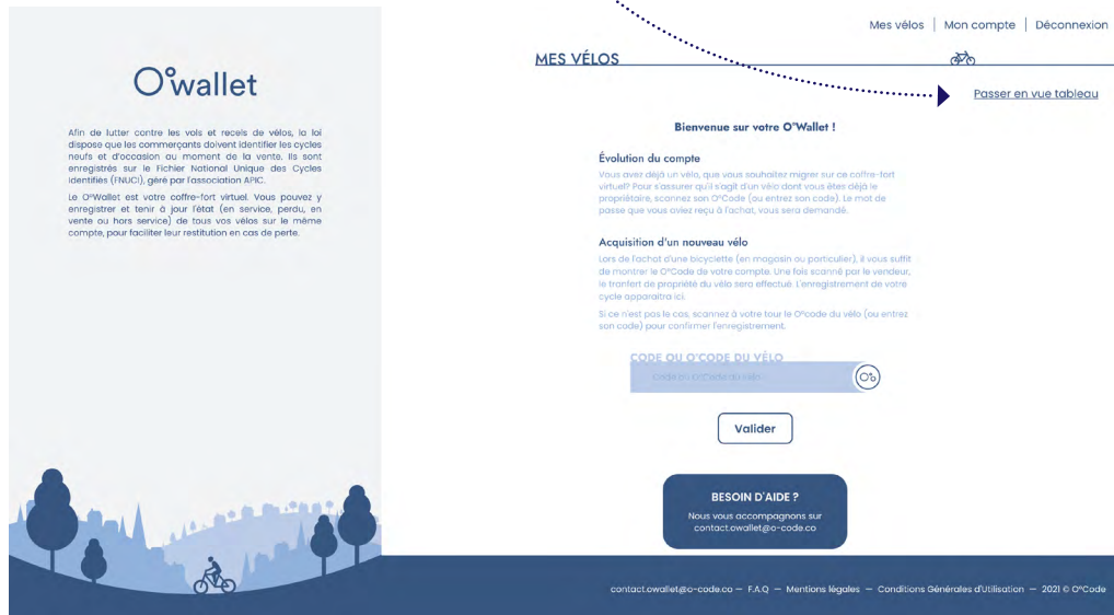
Interface à l'ouverture d'un compte

Cliquez sur "Passer en vue tableau" (à droite du premier vélo listé, si vous en avez déjà).